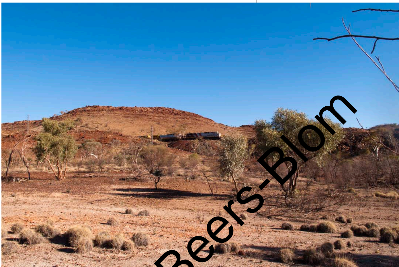
Boven: De prachtige omgeving bij Tom Price Rechts: De Pilbara is een prachtig, ruig outback gebied