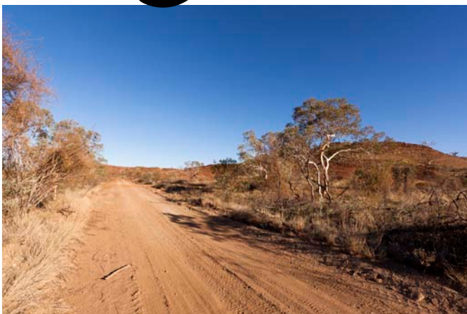
Boven: Diverse variaties van roodbruin in één rotsblok Links: Het ziet er in dit gebied vaak dor en stoffig uit

Na het verlaten van Tom Price richting Nanutarra gaat de route eerst over een track van ongeveer 80 km.